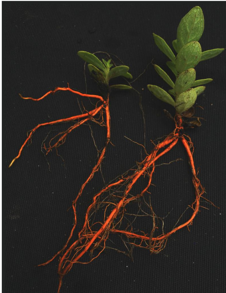
Plantas de azafrán de raíz en las que se aprecia el intenso color rojo anaranjado de sus raíces debido a la acumulación de azafrina.